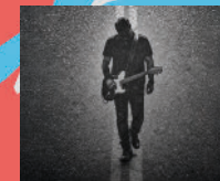
Viernes, 5 de junio: 23:30 h REVÓLVER